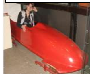
11.b kl.-Sporta muzejā