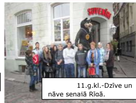
11.g.kl.-Dzīve un nāve senajā Rīcā.