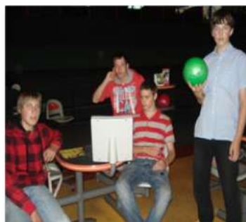
9.c kl.- Zelta boulinga centrā