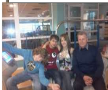
11.d kl.- Zelta boulinga centrā