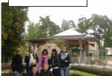
10.c kl.- Zooloģiskajā dārzā