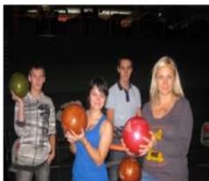
12.d kl.-Zelta boulinga centrā