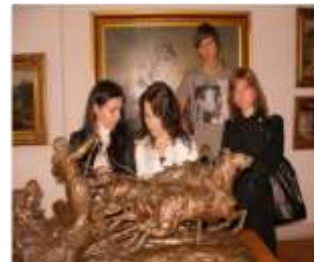
10.a kl.-Mākslas muzejā