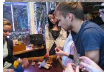
11.c kl.-Tehnoannas pagrabos